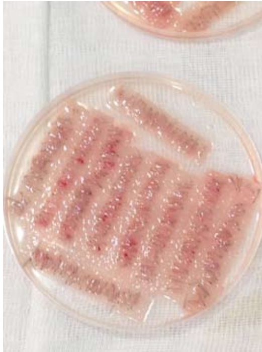
Folículos preparados para ser inyectados.

- Isoflavonas: favorecen el crecimiento del cabello.